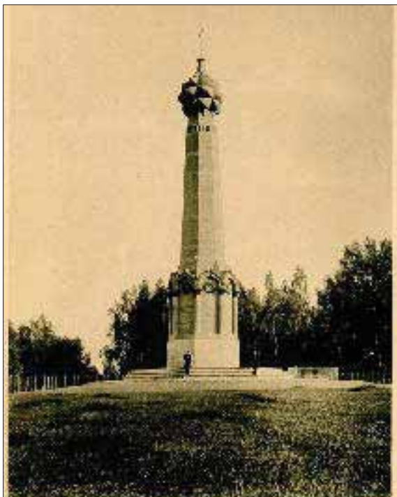
Напомнимся вехи: курганъ въ 1839 г. на зѣлкѣ срытой батареи Раевскаго; подлѣ него могила князя Багратиона; на сучешкахъ — прирѣзные прахосты: кѣи и палицы. Росн. ил. 1812 г. не обидл.

Мы с ними пришли от позднего поезда сюда, на поле в темноту ночи, вслепую поставили палатку метрах в 20 от ворот бывшего монастыря, где была в старину и гостиница для приезжающих на поклон героям и где Толстой провел несколько дней, осматривая Бородинское поле.