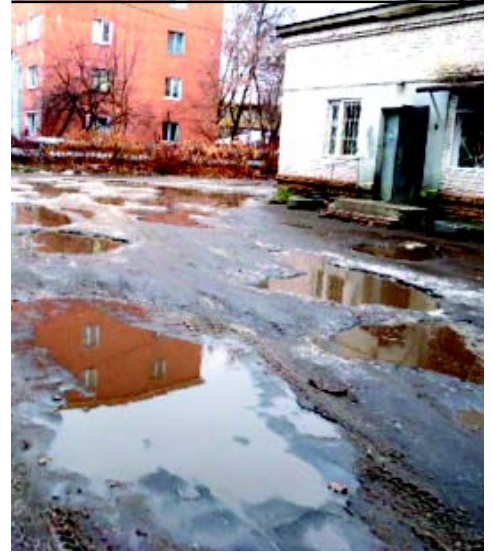
То, что не показывают Губернатору (ул. Советская, за милицией)