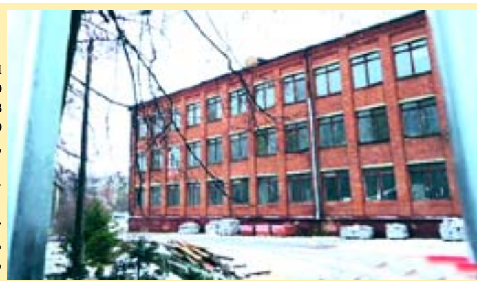
Напрасно жители спорили, какой школа откроется 1-

Детей, с 1-го сентября вместе с персоналом 3-й школы перевели во вторую. А чтобы им было ещё хуже, открыли очередную стройку прямо напротив школы, на стадионе. И проход от второй школы на стадион, куда водили детей для занятий физкультурой, закрыли.