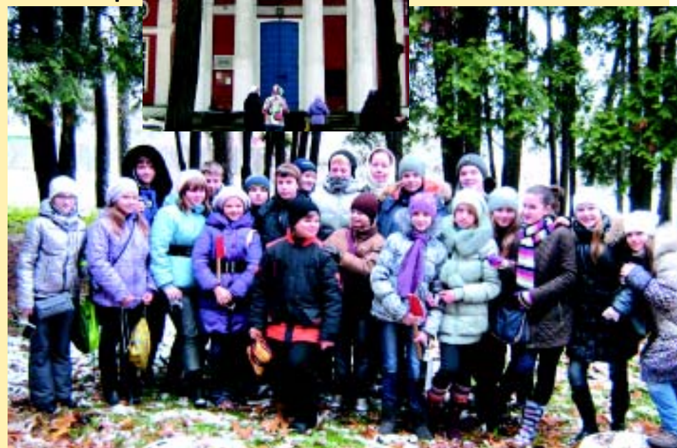
Ученики 6Б-класса гимназии г. Щелкова в зале ЦДК «Гребнево» (верхнее фото) и в парке у Музея Трубецкого в ЦДК «Гребнево» (внизу).

Задача краеведов - в течение года вернуть России имя её национального героя - князя Дмитрия Трубецкого, чтобы оно заняло достойное место рядом с именами Кузьмы Минина и князя Дмитрия Пожарского. Надеемся, что тогда проблема реставрации усадьбы ГРЕБНЕВО в вотчине национального героя России зазвучит по-другому.