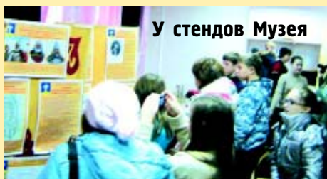
У стендов Музея

В Центре культуры и досуга «Гребнево» Гребневского сельского поселения 3 ноября открылась первая экспозиция Музея «Князь Дмитрий Трубецкой - национальный герой России».