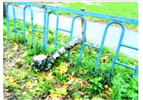
Покурим... березовую трубку?