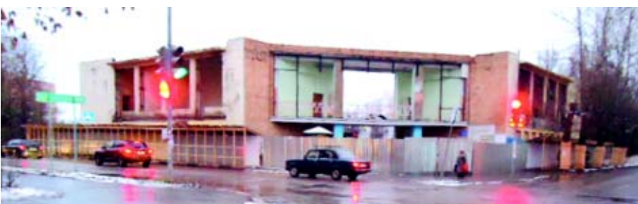
...на территории спорткомплекса «Олимп» над существующим зданием (Комсомольская, 19) будет надстроено еще 2 этажа для размещения очередного платного медцентра? Пока здесь неизвестно кто строит неизвестно что: на заборе, окружающем стройплощадку, нет щита с необходимыми реквизитами для информации жителей, как это сделано, например, на ул. Советской (фото справа). Фото слева сделано 16.11.2011.